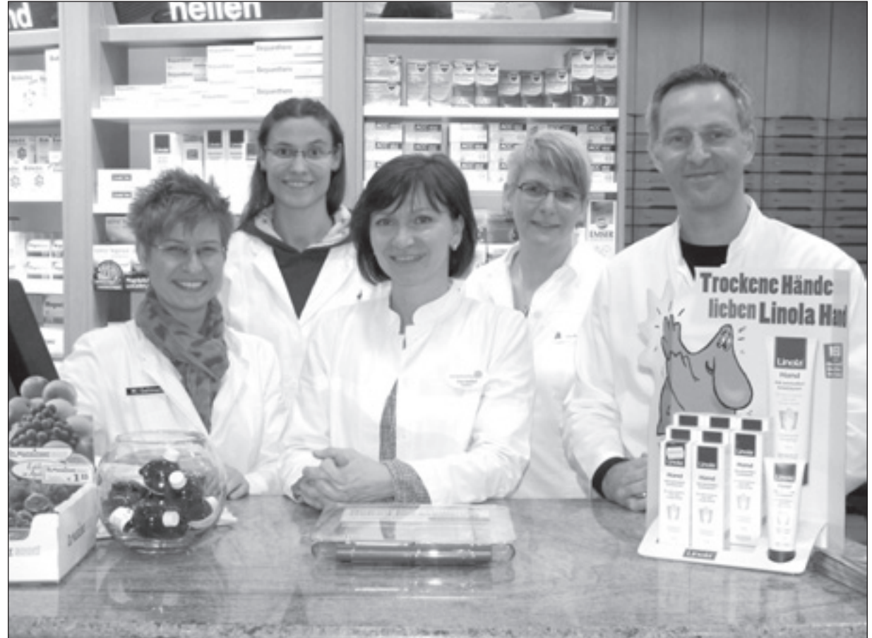
Das Team der Falkenapotheke