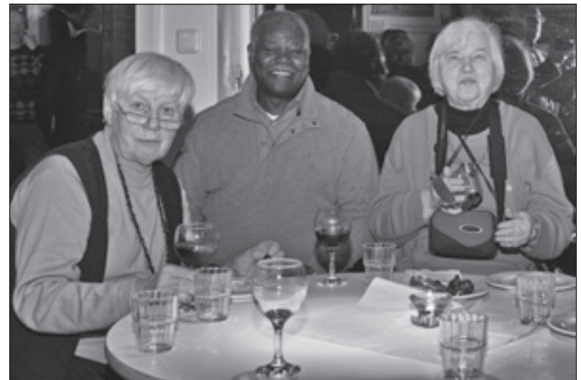
Kirche im Quartier in der Jeremia-Gemeinde