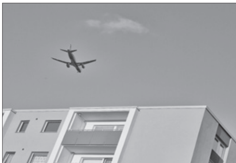
Dies wird der letzte Flieger sein – am 2. Juni um 0:00 Uhr