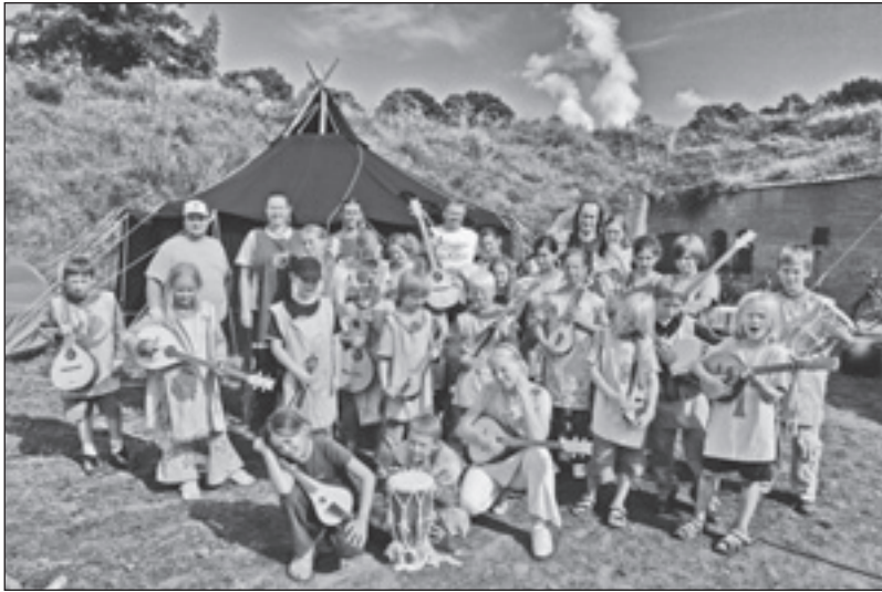
Klang-Holz e.V. beim Kinderzeltlager auf der Zitadelle

Zu Jahresbeginn erreichte das Quartiersmanagement eine Vielzahl neuer und interessanter Projektideen zu den Themen Bildung, Qualifizierung, kulturelles Leben sowie Nachbarschaft und Integration im Stadtteil. Aus den