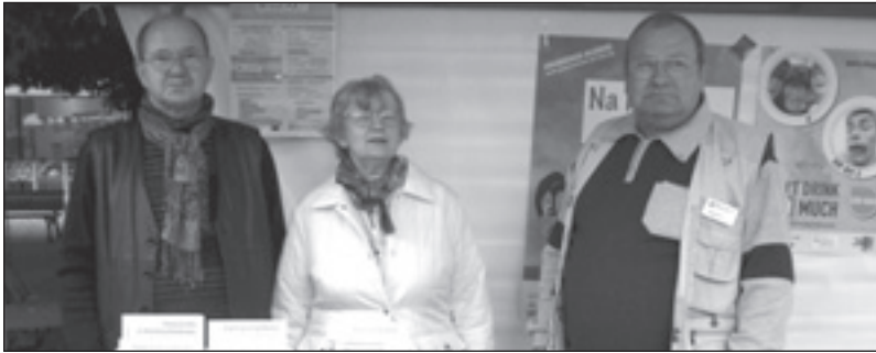
Die Ehrenamtlichen präsentieren sich auf dem Fest