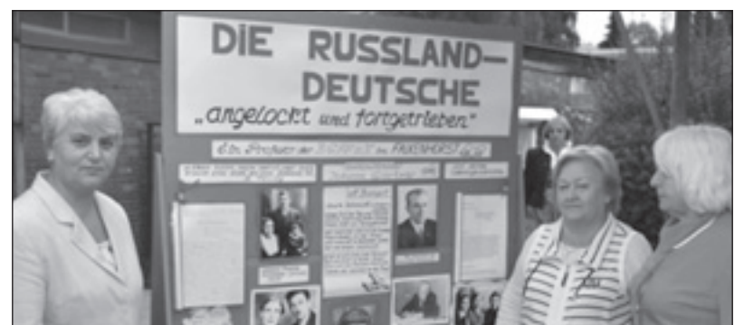
Die Autoren präsentieren ihre Tafel auf dem Stadtteilstfest

In unserem Projekt verfolgten wir das Ziel, die Schicksale der Russland-Deutschen am Beispiel ausgewählter Familien darzustellen. Anhand von Fotos und Erzählungen der Menschen wollten wir einerseits zeigen, wie die deutschen Vorfahren dieser Familien vor einigen hundert Jahren nach Russland kamen und wie sie dort gelebt haben. Andererseits sollte dargestellt werden, wie sie zu Beginn des 20. Jahrhunderts verfolgt und nach dem Ausbruch